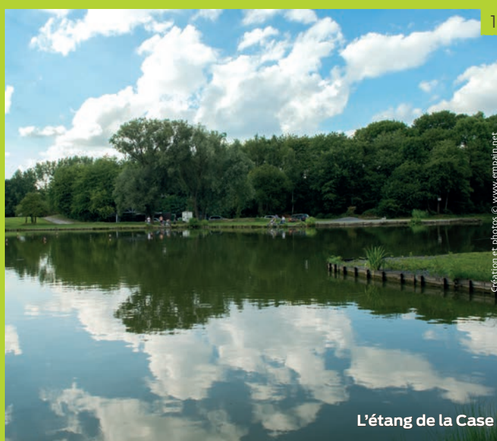
L'étang de la Case

De nos jours, le Centre d'Initiation à la Nature et à l'Environnement y est installé et présente un éventail d'expositions didactiques. Les visiteurs intéressés peuvent y découvrir une exposition permanente retraçant le passé historique, économique et social du lieu-dit « La Courte », où se situent les terrils, vestiges du charbonnage, ainsi que différentes expositions temporaires liées à l'environnement. La salle Pierre Stalon met quant à elle en valeur de belles collections préhistoriques et paléontologiques binchoises et africaines.