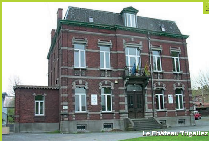
Le Château Trigallez

Magnifique vue de Binche et de la région environnante